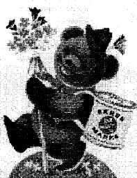
1974: Deutschland wird wieder Fußballweltmeister. Und wie schon 20 Jahre zuvor genießen die Freunde des runden Leders ihren Kaffee vor dem Bildschirm. Goldbraun und vollmundig im Geschmack. Dank der guten Bärenmarke.