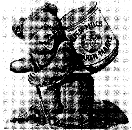
1954: Die Bärenmarke kommt auf den Nierentisch. Besonders beliebt ist sie zu „echtem Bohnenkaffee“, den man jetzt überall wieder bekommt.