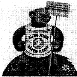
1949: Es gibt fast schon wieder alles zu kaufen, was das Herz begehrt. Natürlich auch unsere gute Bärenmarke. Zum ersten Mal zu DM-Preisen.