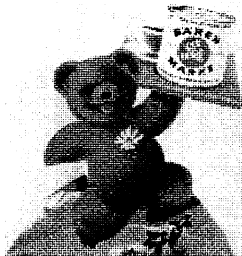
1962: Die Bärenmarke wird 50 und unser Bär rundlicher. Bei seinem ersten Auftritt im Werbefernsehen prägt er den Satz, der bis heute seine Gültigkeit hat: Nichts geht über Bärenmarke.