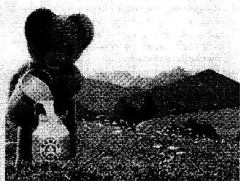
1987: Vieles hat sich seit Beginn unserer Geschichte geändert. Die hohe Qualität der Bärenmarke ist geblieben. Seit 75 Jahren. Zum Geburtstag verlosen wir 75 Reisen. 6 Tage für 2 Personen ins Allgäu – die Heimat der Bärenmarke. Und 7.500 faszinierende Bildbände „Naturparadies Alpen“. Viel Glück! Nichts geht über Bärenmarke.