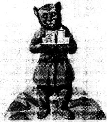
1923: In Köln wechselt die teuerste Bärenmarke-Dose aller Zeiten für sage und schreibe 35 Billionen Reichsmark ihren Besitzer.