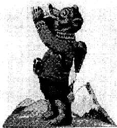
1936: Bei einer guten Tasse Kaffee – verfeinert mit unserer Bärenmarke – lauschen Millionen der Übertragung aus dem Berliner Olympiastadion.