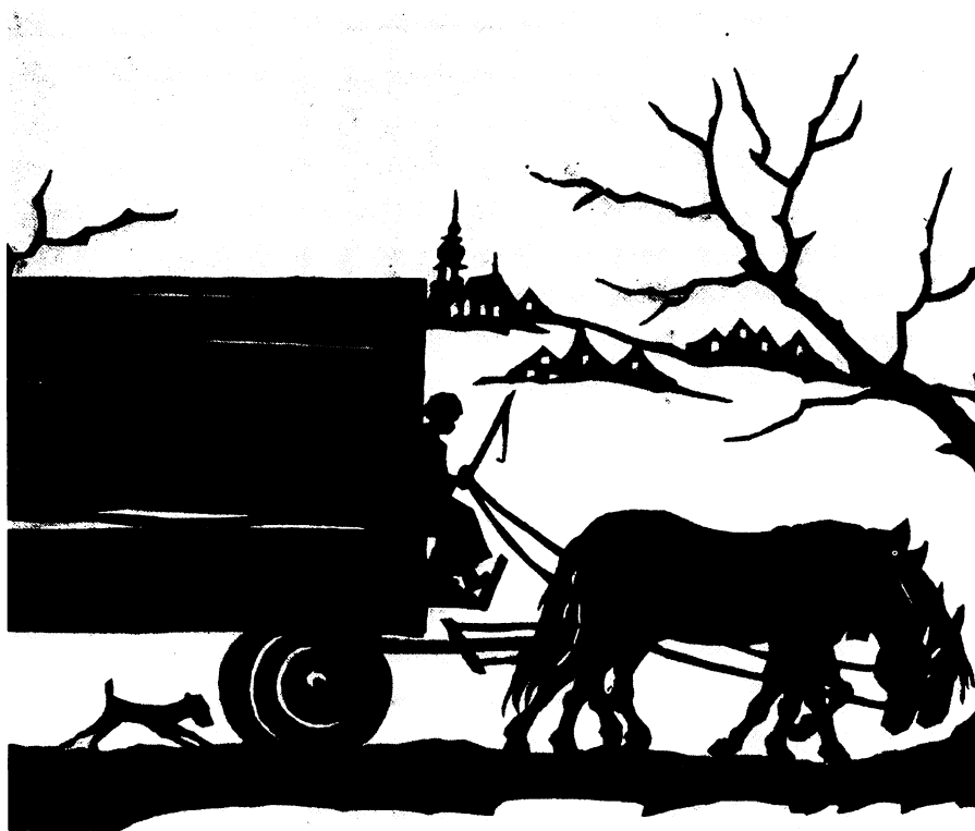
Scherenschnitt von Josy Meidinger