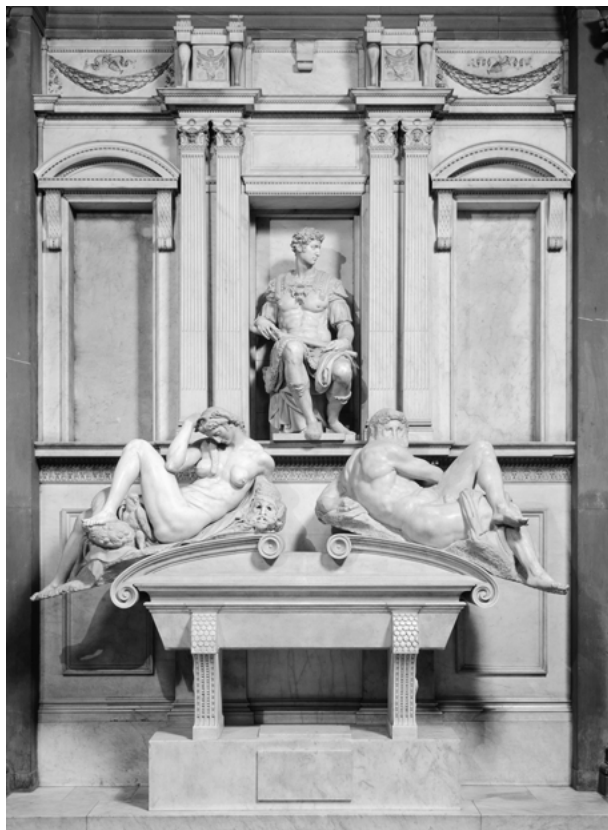
Fig. 4: Michelangelo, Tomba di Giuliano de' Medici, Firenze, San Lorenzo, Sagrestia Nuova.

siero”, definizione che si addice appunto alla posizione del mento che poggia sulla sua mano (Fig. 5).