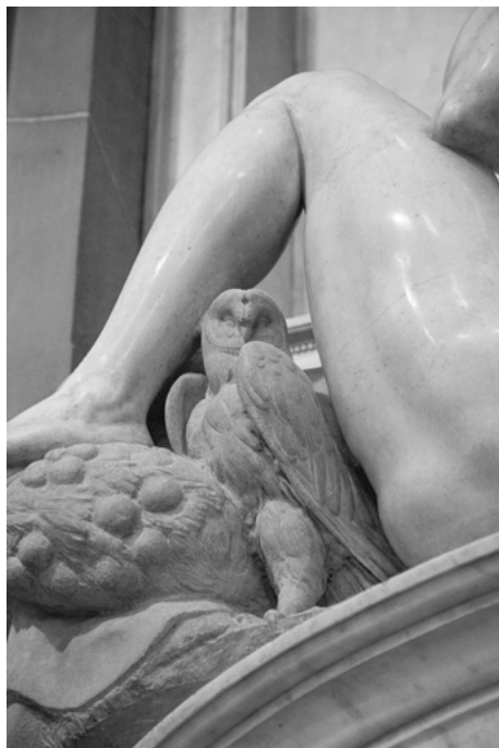
Fig. 16: Michelangelo, Nocturne (dettaglio con la civetta), Firenze, San Lorenzo, Sagrestia Nuova.

ché le quattro figure sono personificazioni dello “earthly time” al quale i Medici, come tutti i mortali, furono soggetti, ma anche in quanto il passaggio delle ore è un tema centrale della liturgia della Resurrezione, evocato, come scoperto da Ettliger, proprio a metà del Salterio clementino. 96 I quattro finestroni della cappella e la lanterna, sui dettagli della quale Michelangelo lavorò con grande attenzione, permettono alla luce e al buio naturali di entrare a tutte le ore del giorno nello spazio della cappella, corrispondendo allo scorrere del giorno rappresentato dalle statue marmoree (Fig. 17). Queste, con il loro alternarsi a diversi livelli di finitura, oltre a diventare modelli artistici, dovettero in effetti diventare anche parte delle orazioni perpetue che, pur modificate nel tempo da consecutive ordinanze papali, si tennero nella cappella fino al 1629 (quando Urbano VIII abolì