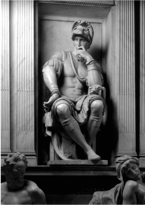
Fig. 13: Michelangelo, Lorenzo de' Medici, Firenze, San Lorenzo, Sagrestia Nuova.

simili tra di loro, contrastano tra loro molto meno di quanto non facciano il Giorno e la Notte . Aurora sembra in attitudine di svegliarsi, mentre Crepuscolo in quella di addormentarsi: tutto in questa cappella fa insomma pensare al ciclo sonno/veglia.