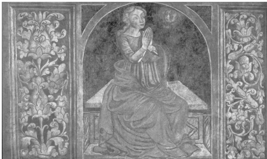
Fig. 3: Viterbo, Palazzo Spreca, affresco: Speranza.

È stato suggerito che questa Vergine assai insolita sia legata a una personificazione della speranza, che si trova in un affresco quattrocentesco proprio a Viterbo (Fig. 3). Tuttavia, bisogna notare che, nell'iconografia più diffusa, Speranza prega verso il sole (si veda, per esempio, anche nel frontespizio dalla raccolta di Rime spirituali , qui studiata da Marc Föcking). Invece, la mascolina figura creata da Sebastiano e Michelangelo si volge verso la luna. Possiamo quindi pensare che l'attitudine di Maria non alluda tanto alla speranza, quanto invece alla vigilanza che opera di notte: Maria veglia, in effetti, da sola nel "paese tenebroso" di impostazione veneziana, più tardi lodato da Vasari come "bellissimo". Allo stato attuale delle conoscenze, è impossibile stabilire (ed è quindi forse inutile chiederselo) se davvero questa veglia notturna abbia qualcosa a che vedere col Concilio Lateranense V e con le minacce di scisma e i turbamenti che già scuotevano la Chiesa. È invece certo che, guardando quest'opera, si ha la forte impressione che si tratti di un invito a restare spiritualmente svegli insieme a Maria attraverso una contemplazione prolungata del dipinto stesso che rappresenta il lento passare delle ore notturne sul corpo morto di Cristo, in attesa della sua resurrezione.