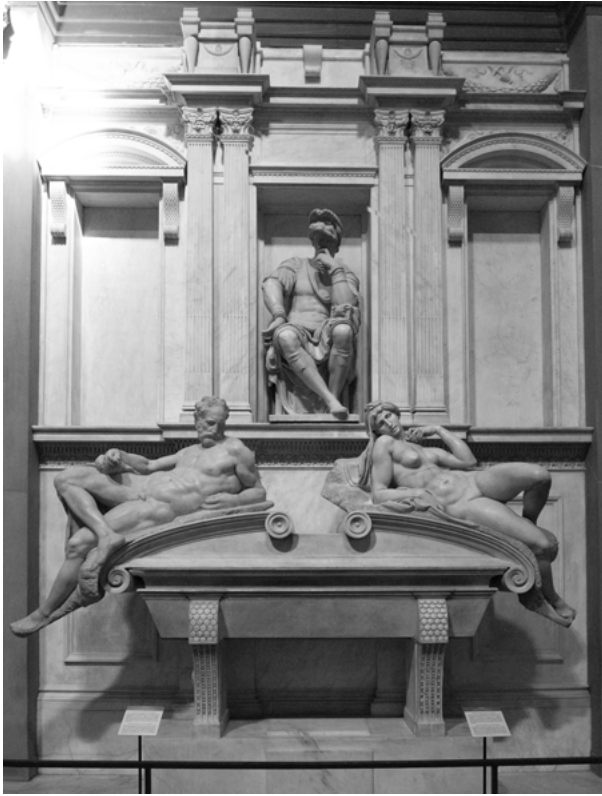
Fig. 17: Michelangelo, Tomba di Lorenzo de' Medici, Firenze, San Lorenzo, Sagrestia Nuova (immagine con la luce naturale alle ore 9:10 del mattino, 4 luglio 2022).

la recita notturna del salterio) e poi fino al 1807, quando il Capitolo ottenne una riduzione della recita del Salterio a una volta sola al mese, divisa in sei tornate. 97 Al tempo stesso, l'insistenza sulla 'notte vigile' e un acuto senso del passaggio del tempo, sempre sottoposto a scadenze lavorative spesso disattese, sembrano temi che interessano personalmente Michelangelo, e che emergono anche nei suoi scritti poetici. Il tempo, quindi, non è mai 'annullato' in questa cappella, 98 ma è sempre riaffermato nel suo incessante scorrere in maniera ritmicamente scandita.