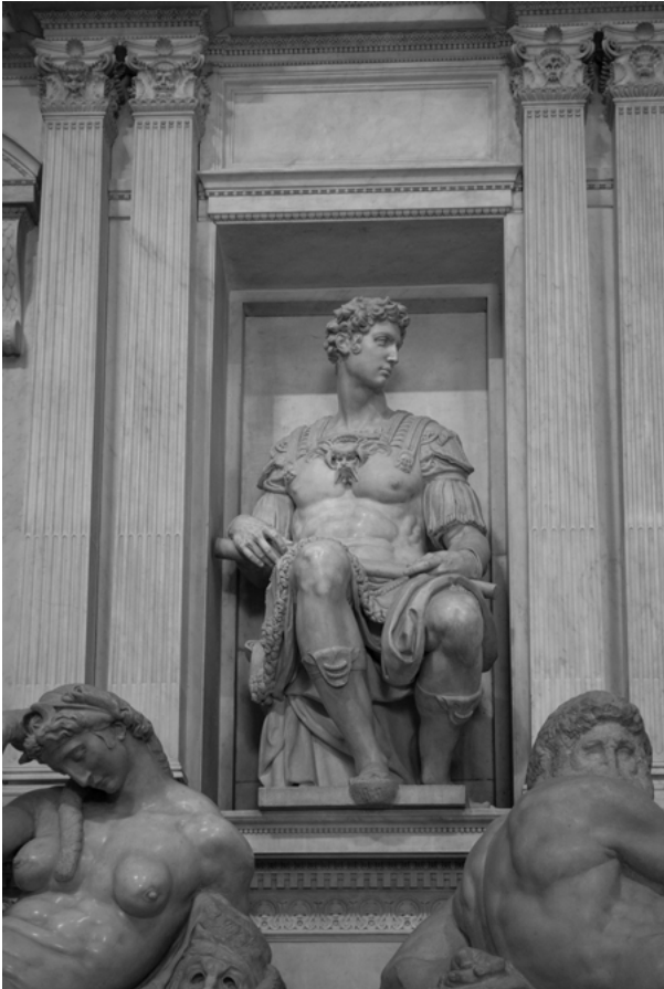
Fig. 15: Michelangelo, Giuliano de' Medici, Firenze, San Lorenzo, Sagrestia Nuova.

eroico, pure presente nella concezione dei due sepolcri). In secondo luogo, l'inusuale (per Michelangelo in questa cappella) finitezza e sovrabbondanza semantica della Notte indica un interesse speciale dello scultore per questa figura, che non solo è delle quattro la più finita, ma sembra anche essere la prima della serie dal punto di vista dell'esecuzione e da quello percettivo di chi si trova a osservare le quattro statue da diversi punti di vista dentro la cappella. Senza dubbio “the celebrated sculptures representing the Times of Day fit perfectly into this Christian context”. 95 Questo vale in molti diversi sensi: non solo per-