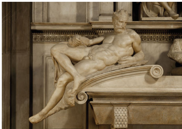
Fig. 11: Michelangelo, Crepuscolo, Firenze, San Lorenzo, Sagrestia Nuova.