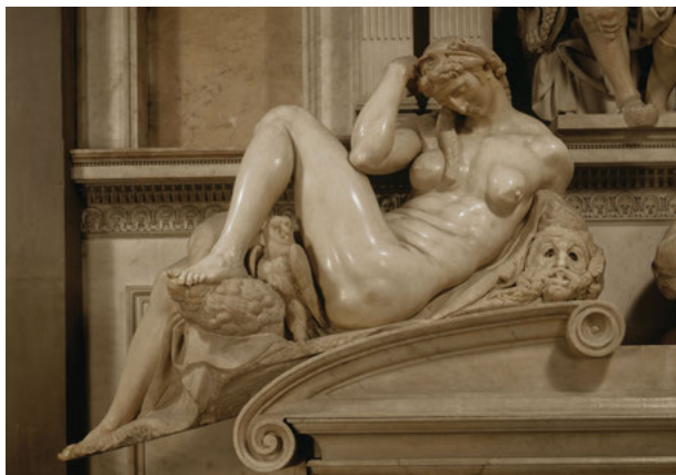
Fig. 9: Michelangelo, Notte , Firenze, San Lorenzo, Sagrestia Nuova.