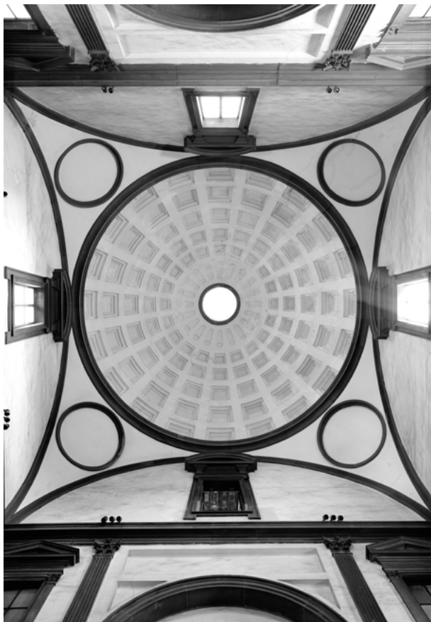
Fig. 1: Firenze, San Lorenzo, Sagrestia Nuova, cupola.

della notte”). 6 I significati dell’ alternanza delle ore e del passaggio del tempo in relazione, non solo, alle funzioni liturgiche di questo spazio, ma anche ai tempi del lavoro dell’artista, sono stati invece sottovalutati.