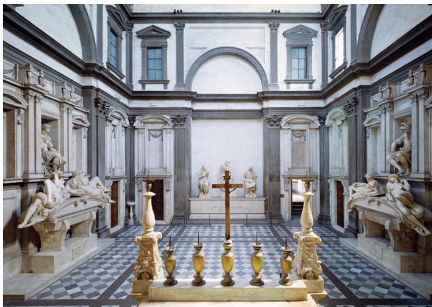
Fig. 14: Firenze, San Lorenzo, Sagrestia Nuova, veduta dell'interno dall'altare.

verso la cappella nella direzione principale della statua della Madonna, la prima delle quattro figure che salta all'occhio, proprio a causa della sua maggior politezza e lucentezza, ma anche della sua posizione volta verso l'altare, è sempre inevitabilmente la Notte , che è posta alla sinistra dell'osservatore; dopodiché l'occhio si sposta sulla figura che è davanti a lei, ovvero sull' Aurora alla destra dell'altare. In effetti, anche nella lettera citata in apertura "le dua femine", che Mini andò a vedere di persona la mattina dopo aver passato la serata con Michelangelo a "ragionare d'arte", sono definite rispettivamente come "prima" figura e seconda figura ("questa sichonda"). Seguendo quest'ordine, e sempre guardando dall'altare, lo sguardo si posa, dunque, prima su Notte , poi su Aurora , poi può tornare sul Giorno e infine chiudere sul Crepuscolo , per ricominciare da capo attraverso lo spazio della cappella.