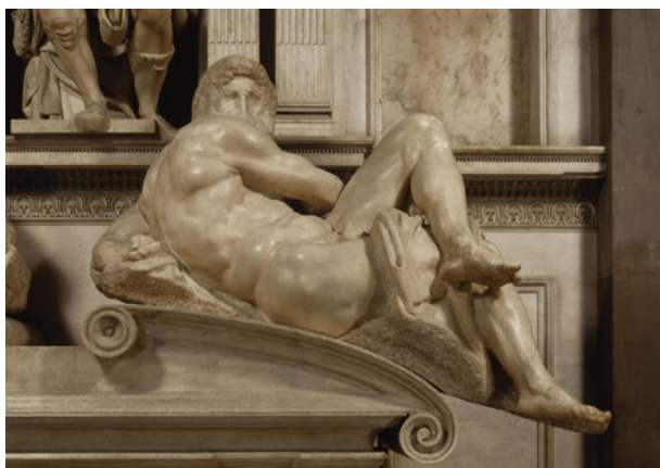
Fig. 10: Michelangelo, Giorno , Firenze, San Lorenzo, Sagrestia Nuova.

(“veloce corso” scrive Michelangelo nella sua nota) di intervalli temporali opposti tra ore diurne e ore notturne (notte/giorno; aurora/crepuscolo) era d’interesse per l’artista, rimanendo, alla fine, l’elemento portante dell’invenzione allegorica (nella stessa descrizione di Condivi le figure dei due Capitani sono menzionate solo dopo, quasi come elementi meno importanti e scontati: “ci son poi altre statue, che rappresentano quelli per chi tai sepolture sono fatte”). 79