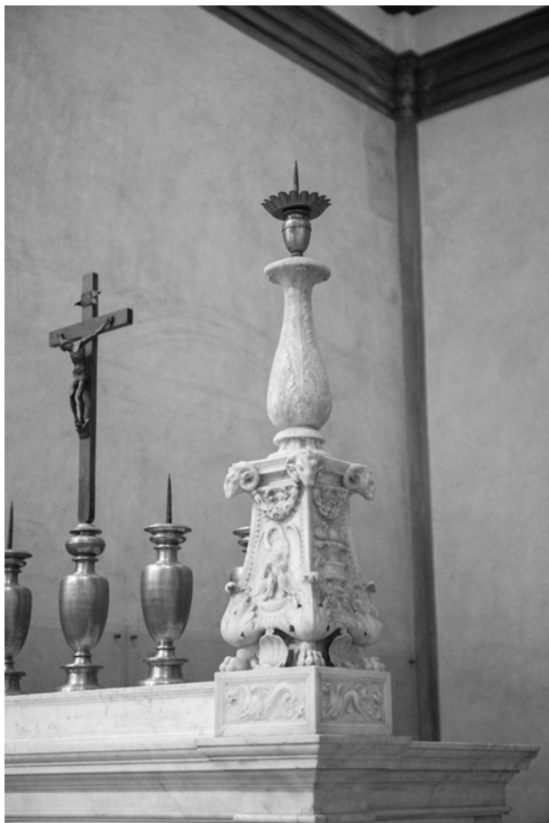
Fig. 6: Firenze, San Lorenzo, Sagrestia Nuova, candelabro.

Leone X scomunicasse Lutero, fu eseguita in un arco di tempo che vide, a Roma, la crisi del Sacco (1527) e quindi, a Firenze, la crisi del regime mediceo con la cacciata del duca Alessandro e la Seconda Repubblica, di cui lo stesso Michelangelo fu un sostenitore. La lettera citata in apertura appartiene al periodo della restaurazione medicea quando Clemente VII richiamò Michelangelo a Firenze perché finisse i lavori, poi rimasti interrotti con la definitiva partenza per Roma e la morte del papa nel 1534.