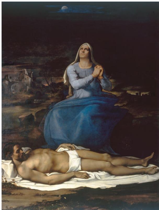
Fig. 2: Sebastiano del Piombo, Pietà, Viterbo, Museo Civico.

sformato nell'immagine di una veglia funebre. In secondo luogo, per il modo in cui questo dipinto rappresenta il passaggio del tempo e delle ore. 30