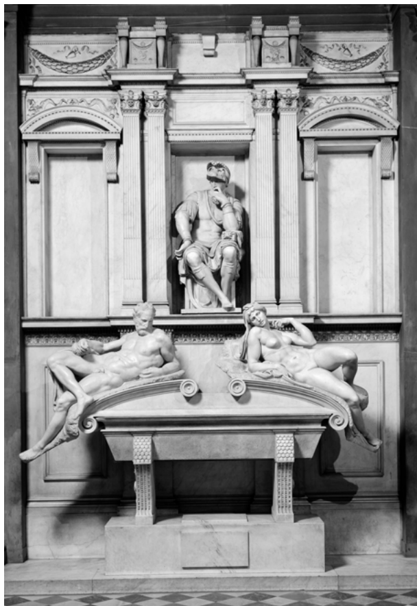
Fig. 5: Michelangelo, Tomba di Lorenzo de' Medici, Firenze, San Lorenzo, Sagrestia Nuova.

_____ tni, nell'autunno Michelangelo torna a lavorare per Clemente VII ("e così riaprimo la fabrica l'anno 1530"). Recenti messe a punto della cronologia, dei tempi di progettazione ed esecuzione delle statue per la cappella, in relazione, rispettivamente con i disegni disponibili e con considerazione pratiche relative all'esecuzione materiale, sono offerte da: Carmen Bambach, Michelangelo: Divine Draftsman and Designer , New York 2018, pp. 112–129, p. 112; Claudia Echinger-Maurach, "E si rinasce tal concetto bello". Michelangelo e la genesi delle sculture nella Sagrestia Nuova, in Michelangelo. Arte – Materia – Lavoro , pp. 198–216 (entrambe con bibliografia precedente). In particolare per il primo periodo di progettazione si veda Johannes Wilde, "Michelangelo's Designs for the Medici Tombs", in: Journal of the Warburg and Courtauld Institutes 18 (1955), pp. 54–66.