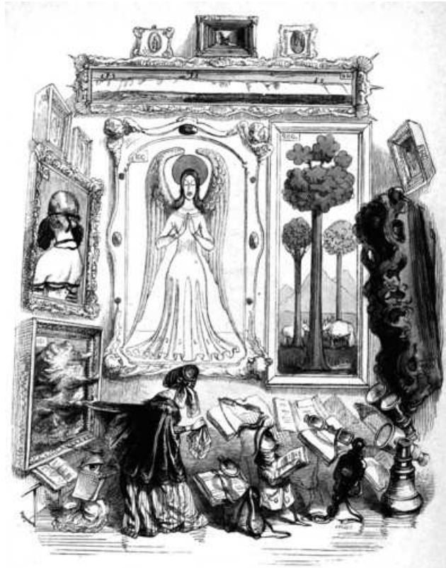
26 Grandville: Die Ausstellung , 1844, aus: ders.: Un autre monde , Paris 1843