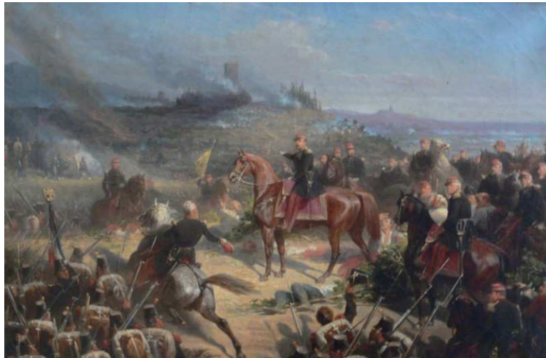
20 Adolphe Yvon: Die Schlacht von Solferino , 1861, Öl auf Leinwand, 600 x 900 cm, Musée national du Château de Compiègne

allerdings, dass Meissonier trotz des Gattungswechsels bei seinen kleinen Bildformaten blieb. Üblich waren für Historiengemälde Großformate – so verwendete der französische Schlachtenmaler Adolphe Yvon für ein ebenfalls der Schlacht bei Solferino gewidmetes Gemälde eine Leinwand von 6 x 9 Metern. Meissoniers Bild misst dagegen nur 43,5 x 76 Zentimeter (Abb. 20 und 21).