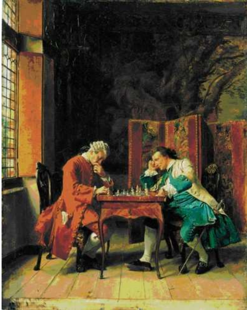
11 Ernest Meissonnier: Die Schachspieler , 1856, Öl auf Holz, 27 x 21,6 cm, Hamburger Kunsthalle

In derselben Ausstellung hing jedoch ein Gemälde, bei dem sich nach Ansicht Michels ein solches Schwelgen im Beiwerk vom dargestellten Motiv her verbot (Abb. 12). Im Falle der Schachspieler war Meissonniers Detailverliebtheit durchaus angemessen,