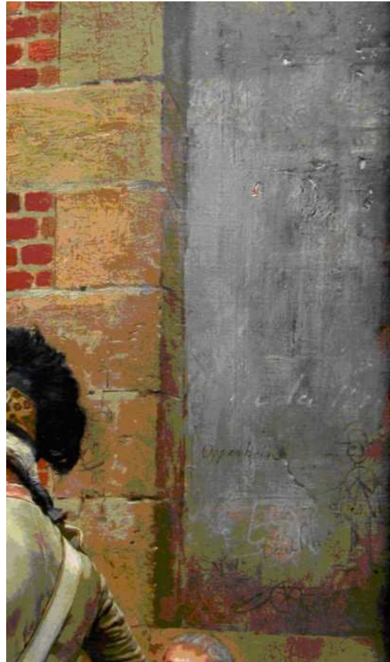
7 Detail aus Abb. 6

Es zeigt eine Wandfläche, deren Verputz stellenweise abbröckelt und die zudem mit Graffiti übersät ist – darunter übrigens der Name des Besitzers des Bildes: Oppenheim. Die Gestaltung dieser Mauer beweist, dass Meissonier keineswegs den Glattmalern zuzurechnen ist. Die Malerei ist hier alles andere als geleckert. Vielmehr zeigt sie ein ausgeprägtes Relief der Farbe – in kleinem Maßstab wohlgermerkt, aber deutlich. Man könnte hier ein – auf eine Wandfläche in einem Gemälde Gérômes gemünztes – Wort von Wolfgang Kemp anwenden und von einem »Aktionsfeld der Malerei« sprechen. 29 Partien wie diese erklären zudem, weshalb Meissonier von Jackson Pollock in die Ahnentafel des action painting eingereiht wurde. 30