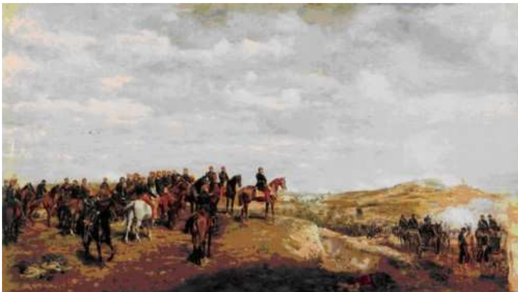
19 Ernest Meissonier: Kaiser Napoléon III. bei der Schlacht von Solferino , 1863, Öl auf Holz, 43,5 x 76 cm, Musée national du Château de Compiègne

Eine anders gelagerte Inversion liegt bei Meissoniers Gemälde Kaiser Napoleon III. bei der Schlacht von Solferino vor (Abb. 19).