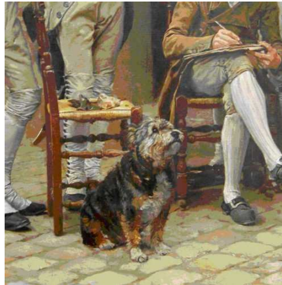
31 Detail aus Abb. 7

Dass ein solch skizzenhaft gemaltes Bild kaum auf Augenhöhe gehängt werden würde, wohin es nur diejenigen Bilder schafften, die auch der nahsichtigen Betrachtung standhielten, wird Manet nicht nur gewusst, sondern wohl vielmehr eingeplant haben. Schließlich hätte eine Hängung auf Augenhöhe auch der Idee eines Balkons widersprochen, zu dem ein ebenerdig platzierter Betrachter ebenfalls aufzuschauen hat.