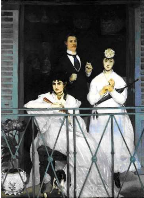
28 Edouard Manet: Der Balkon , 1868-1869, Öl auf Leinwand, 169 x 125 cm, Paris, Musée d'Orsay

Unter den ausstellenden Künstlern wurde insbesondere Manet immer wieder vorgehalten, durch seine Gemälde Aufsehen erheischen und Skandale erregen zu wollen. Tatsächlich verstand es Manet, den Salon geschickter als viele andere Künstler zu bespielen. Das soll hier kurz anhand seines im Salon von 1869 ausgestellten Gemäldes Der Balkon erörtert werden (Abb. 28).