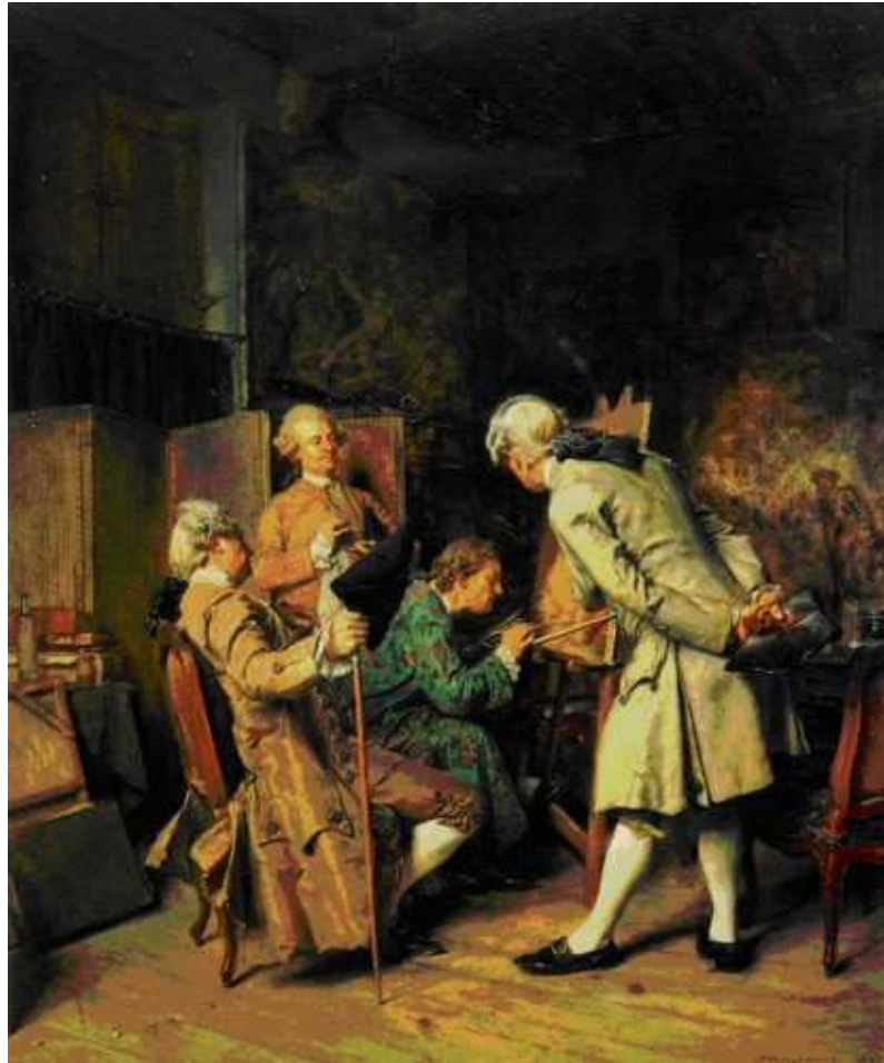
24 Ernest Meissonier: Die Kunstliebhaber , 1860, Öl auf Holz, 35,5 x 28,5 cm, Paris, Musée d'Orsay

Dass das stille Kämmerchen den idealen Ort für die Betrachtung der Werke Meissoniers darstellt, ist auch die Auffassung Théophile Gautiers. Einen solchen idealen Ort malt er sich etwa für Meissoniers im Salon von 1845 ausgestelltes Gemälde Leibwache (Garde du corps) aus 42 : »Wenn Die Leibwache sich im Besitz eines reichen Amateurs aus Antwerpen oder Amsterdam befände, dann hätte es mit Sicherheit ein Kabinett für sich und würde nicht mehr als einmal jährlich einer kleinen Schar bewährter Freunde gezeigt, sofern diese die Bereitschaft mitbrächten, 10.000 Gulden als Pfand zu hinterlegen und sich die Taschen beim Weggehen durchsuchen zu lassen.« 43