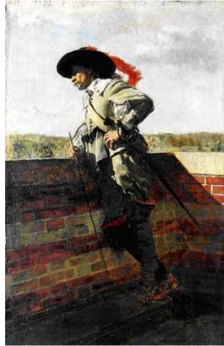
29 Ernest Meissonier: Aussichtsterrasse , 1867, Öl auf Holz, 30,2 x 20 cm, Cleveland Museum of Art

Das Bild ist geradezu ein Musterbeispiel für ›Theatralität‹, wie Michael Fried sie der ›Absorption‹ entgegengesetzt hat. Zwar blicken die Figuren auf dem Gemälde ähnlich konzentriert wie etwa die Gestalt auf Meissoniers Gemälde einer Aussichtsterrasse (Abb. 29) – im Unterscheid zu dieser blicken sie aber aus dem Bild heraus. Dass sie mit dem Betrachter in Beziehung treten, liegt jedoch vor allem am Format, das Manet erlaubte, die Figuren nahezu lebensgroß wiederzugeben. Bild- und Betrachtterraum werden auf diese Weise miteinander verschränkt. Meissoniers Figur dagegen gehört nicht nur durch ihr altmodisches Kostüm einer anderen Welt an, sondern auch durch ihre geringe Größe – die Figur misst nur wenige Zentimeter. Während die Kleidung sie im 18. Jahrhundert verortet, versetzte sie ihre Winzigkeit in den Augen der zeitgenössischen Kritiker ins Reich der Liliputaner. 50