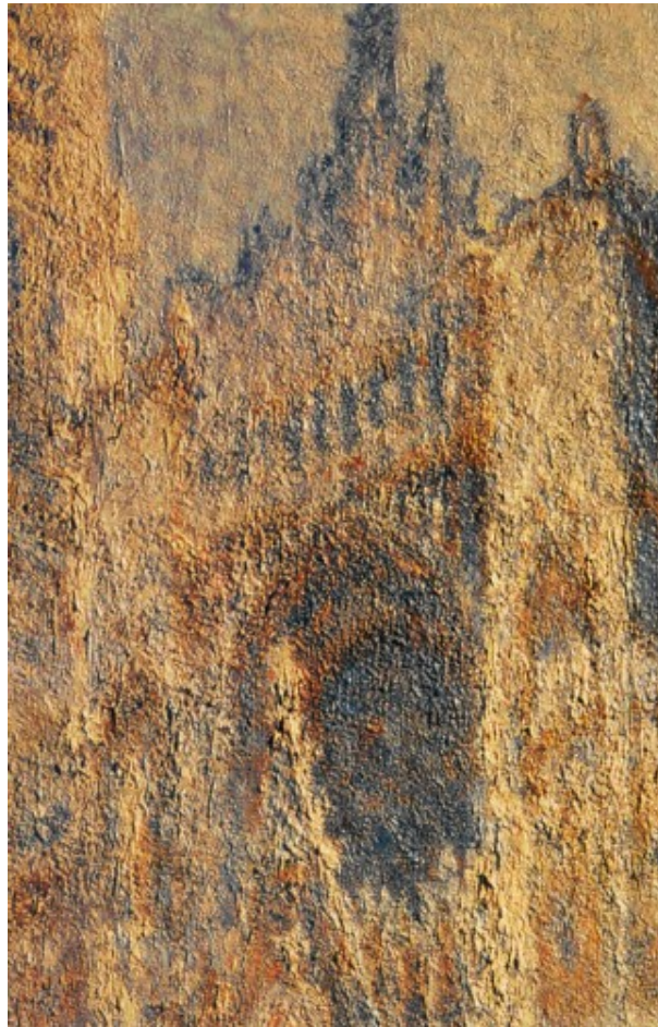
3 Detail aus Abb. 2

Angesichts der Feuerwerke, welche die Impressionisten abbrennen ließen, heißt es in einer anderen Rezension desselben Autors, sollte man doch besser Sicherheitsbarrieren errichten. 5