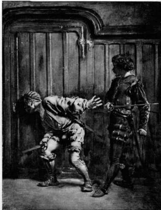
13 Ernest Meissonier: Bravos , 1852, Öl auf Holz, 38,1 x 28,7 cm, London, Wallace Collection

zweier Bravos, zweier gedungener Meuchelmörder (Abb. 13). Man stelle sich vor diesem Bild den typischen Meissonier-Liebhaber vor, wie er es durch eine Lupe hindurch betrachtet. Zwei Inspektionen werden hier gleichsam hintereinandergeschaltet: Die Bravos inspizieren durch ein Schlüsselloch ihr Opfer, werden jedoch gleichzeitig vom Bildbetrachter durch die Lupe in ihrem Tun überwacht.