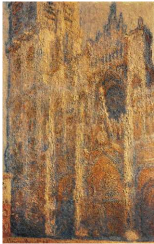
2 Claude Monet: Das Portal ( Kathedrale von Rouen ), 1893, Gesamtansicht, 100 x 65 cm, Puschkin Museum Moskau