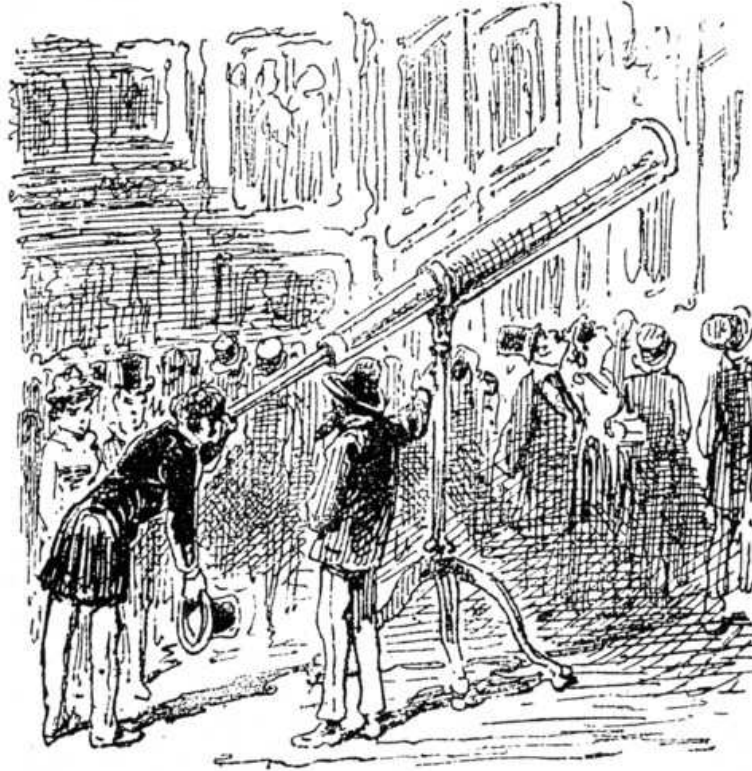
25 Pif [Pseudonym]: Croquis, Im Salon , in: Le Charivari , 23. Mai 1880

Eine Karikatur zeigt, wie ein Künstler, dessen Gemälde dieses Schicksal widerfahren ist, dennoch die Aufmerksamkeit des Publikums auf sein Bild zu lenken sucht (Abb. 25).