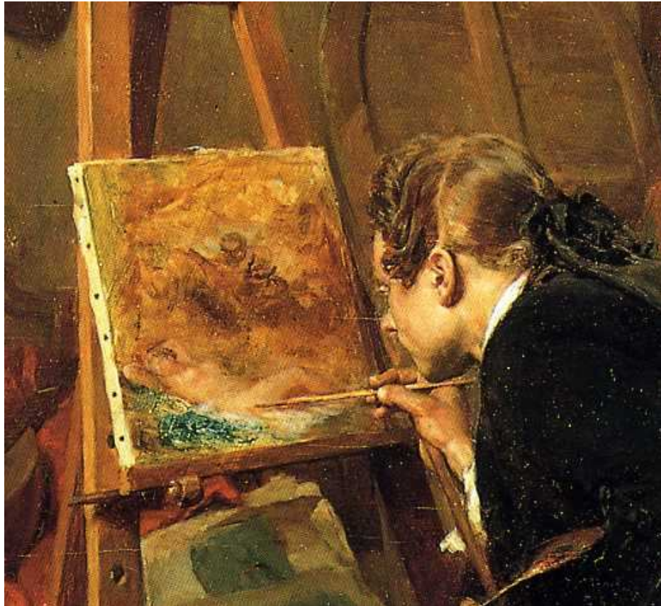
15 Detail aus Abb. 14

Doch nicht nur der Satyr ist ganz von der Nymphe absorbiert. Ähnlich gebannt starrt auch der über die Leinwand gebeugte Maler auf den Körper der Frau, über deren Oberschenkel er gerade mit seinem Pinsel fährt. Denken wir uns jetzt als fiktiven Bildbetrachter jenen Typus von Salonbesucher, der vor den Bildern Meissoniers routinemäßig die Lupe zückte. Für ihn gibt es kein größeres Faszinosum als die Miniatur innerhalb der Miniatur – ein Faszinosum, das dadurch an zusätzlichem Reiz gewonnen haben dürfte, dass dieses Bild im Bild erotischer Natur ist. Man mag hier etwa an eine Subspezies der Aktphotographie denken, die damals in Paris große Popularität genoss: die Mikrophotographie. Bei ihr handelt es sich um eine Aufnahme, die sich nur durch die Lupe anschauen lässt. Das voyeuristische Vergnügen, das einer solchen Betrachtung entsprang, bestand in der Vorstellung, man spähe gerade durch ein Schlüsselloch. 36