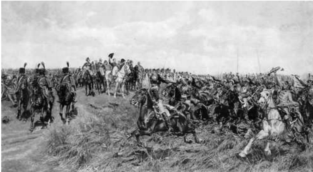
12 Meissonier: 1807, Friedland, 1875 , Öl auf Leinwand, 136,9 x 242,5 cm, New York, The Metropolitan Museum of Art

Dem Bildbetrachter soll demnach die Situation stets so geschildert werden, wie sie ein potentieller Augenzeuge erlebt hätte. Der Zuschauer eines Schachspiels hat Zeit und Muße genug, mit seinen Augen durch den Raum zu schweifen und alle Einzelheiten aufzunehmen. Bei der Darstellung einer Schachpartie ist es daher dem Maler gestattet, sich seiner ganzen Liebe zum Detail hinzugeben. Der in ein Gefecht verwickelte Soldat hingegen hat zum Knöpfzählen nicht die Zeit, will er nicht mit dem Leben zahlen. Er muss den Schauplatz des Geschehens mit einem Blick erfassen können, weshalb auch der Schlachtenmaler sich auf die Wiedergabe des Gesamteindrucks zu beschränken habe – eine Auffassung, die übrigens kaum mit der damaligen Schlachtenmalerei in Deckung zu bringen ist. Das Besondere an Michels Ansicht ist indes, dass sie eine zeitliche Dimension ins Spiel bringt – die sich auch auf den Impressionismus anwenden lässt. So wie die skizzenhaft ausgeführten Werke der Impressionisten sich als Simulation eines flüchtigen retinalen Eindrucks verstehen lassen, simulieren die detailgetreuen Gemälde Meissoniers einen prüfenden, inspizierenden Blick.