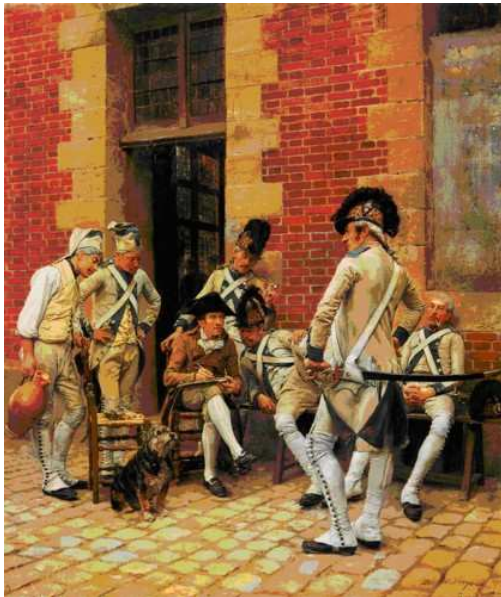
6 Ernest Meissonier: Das Porträt des Sergeanten , 1874, Öl auf Leinwand, 73 x 62 cm, Hamburger Kunsthalle

Meissoniers nicht durch die Lupe betrachten ließen, sondern auf die natürliche Sehkraft des Menschen abgestimmt seien, so grenzte er den Künstler bewusst von der Photographie ab. 28 Auch andere Kritiker betonten immer wieder die malerischen Qualitäten des Künstlers, viele sahen in ihm sogar einen Maler par excellence , für den es allein auf das Malen ankam. Das mag heute verwunderlich erscheinen, wird jedoch verständlicher, wenn man sich etwa ein Detail aus Meissoniers Gemälde Das Porträt des Sergeanten anschaut (Abb. 6 und 7).