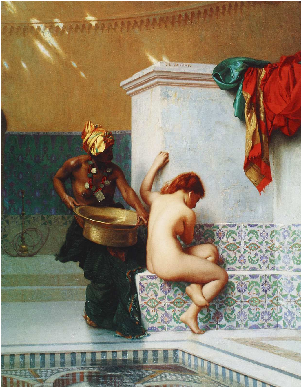
16 Jean Léon Gérôme: Türkisches Bad (Maurisches Bad) , 1872, Öl auf Leinwand, 50,8 x 40,8 cm, Boston, Museum of Fine Arts

Künstlers, die ja einen Blick auf etwas freigaben, das kein Außenstehender sehen durfte, das ganz dem Haremsbesitzer vorbehalten war.