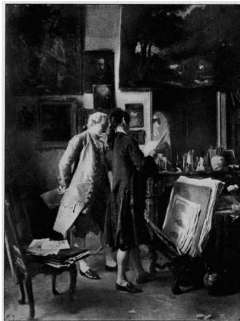
23 Ernest Meissonier: Ein Maler zeigt seine Zeichnungen , 1850, Öl auf Holz, 37,5 x 29,1 cm, London, Wallace Collection

Der ideale Betrachter der Gemälde, so wie ihn die Bilder vorzugeben scheinen, benötigt nicht nur eine Lupe, sondern auch genügend Muße, um sich ganz in ihre Betrachtung vertiefen zu können – jene kultivierte Muße, wie sie so oft in den Gemälden Meissoniers thematisiert wurde, wo noch Bücher gelesen wurden und Zeitungen unbekannt waren. Kein anderer Ort schien für die Betrachtung seiner Gemälde geeigneter als das stille Kämmerchen, in dem seine Figuren sich am liebsten aufzuhalten schienen. Gemütliche Gemächer figurieren auch in den Gemälden Meissoniers als Ort der Bildbetrachtung. Hier zeigt der Künstler dem Kenner seine Werke, hier gibt er den Liebhabern seiner Kunst Kostproben seines Könnens (Abb. 23 und 24).