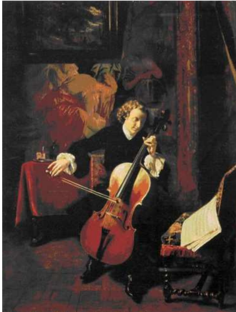
10 Ernest Meissonier: Junger Mann beim Cello Spielen , 1841, Öl auf Holz, 35,6 x 26,7 cm, Omaha, Joslyn Art Museum

Meissoniers Figuren können als Musterbeispiele der Absorption verstanden werden. Meist sind sie in Innenräume platziert, in der Regel handelt es sich um ein ruhiges, bürgerliches, privates Ambiente – Räume, in denen die schweren Teppiche, die als Wandbespannung dienen, jeden Laut zu schlucken scheinen. Hier können ihre Bewohner abgeschlossen vom Trubel der Welt ihre Muße kultivieren, können lesen, Briefe schreiben (Abb. 9), Cello (Abb. 10) oder Schach spielen (Abb. 11).