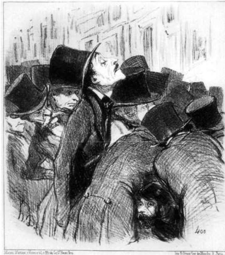
5 Honoré Daumier: Vor den Gemälden Meissoniers , Lithographie, aus: Le Charivari , 3. Mai 1852

Tatsächlich erwähnen auch zahlreiche Salonberichte den Menschaufwurf, den Meissoniers Werke regelmäßig provozierten, wenn sie in der Öffentlichkeit gezeigt wurden. 9 Aus diesen Reportagen wissen wir auch, dass viele der Salonbesucher zum näheren Studium der Gemälde des Meisters sich einer Lupe bedienten.