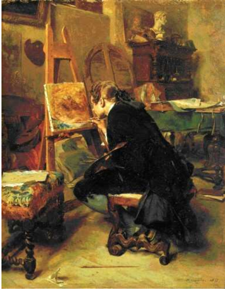
14 Ernest Meissonier: Ein Maler an seiner Staffelei , 1855, Öl auf Holz, 26,7 x 21,3 cm, Cleveland Museum of Art