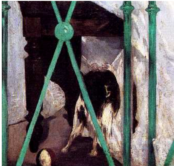
30 Detail aus Abb. 27

Doch auch der Farbauftrag in Manets Gemälde ist Teil der performativen Strategie: Wie grob Manet dabei die Farbe verstrichen hat, zeigt sich besonders drastisch an der Ausführung des Hundes. Dieser ist, wenngleich deutlich größer als der en miniature und in feinmalerischer Präzision wiedergebende Hund auf Meissoniers Gemälde Das Porträt des Sergeanten (Abb. 30, Abb. 31), nur mit wenigen, breiten Pinselzügen hingestrichen.