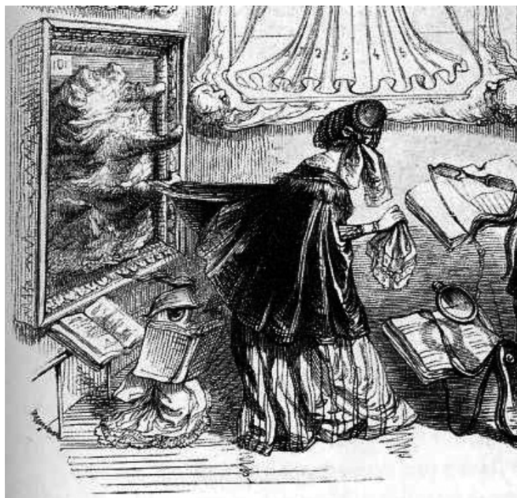
27 Detail aus Abb. 26