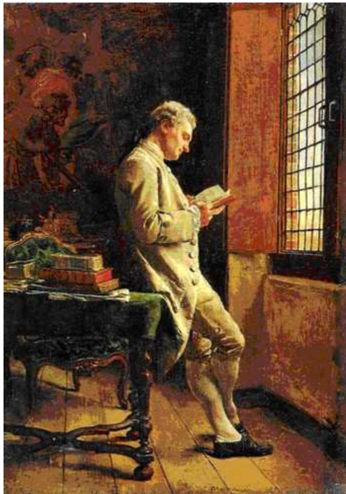
8 Ernest Meissonier: Der weiße Leser , 1857, Öl auf Holz, 21,5 x 15,5 cm, Paris, Musée d'Orsay

Das gilt etwa für das Motiv des Lesers, das vielleicht unter den Zeitgenossen bekannteste Motiv des Künstlers, von dem zahlreiche Varianten aus seiner Hand existieren (Abb. 8).