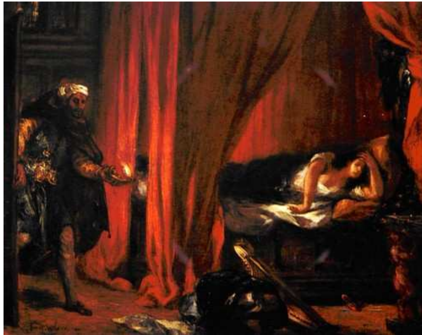
4 Eugène Delacroix: Othello und Desdemona , 1847-1849, Öl auf Leinwand, 50,3 x 60,7 cm, Ottawa, Musée des Beaux-Arts du Canada

sich bei ihnen nur um gesprochene Sprache handelt. Ihre Gemälde – ich spreche von mehreren – sind nichts anderes als eine rein mündliche Rede, die nichts mit geschriebener Wortgewandtheit gemein hat.« 6