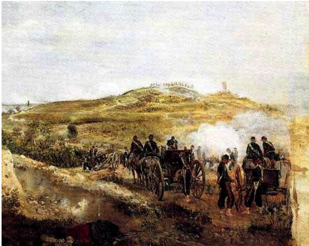
22 Detail aus Abb. 19

zweifach gegen die im 19. Jahrhundert geltenden Normen der Gattung Schlachtengemälde: zum einen durch das kleine Format, zum anderen, indem er das eigentliche Kampfgeschehen in den Bildhintergrund entrückt, dort kaum noch für den Bildbetrachter wahrnehmbar (Abb. 22).