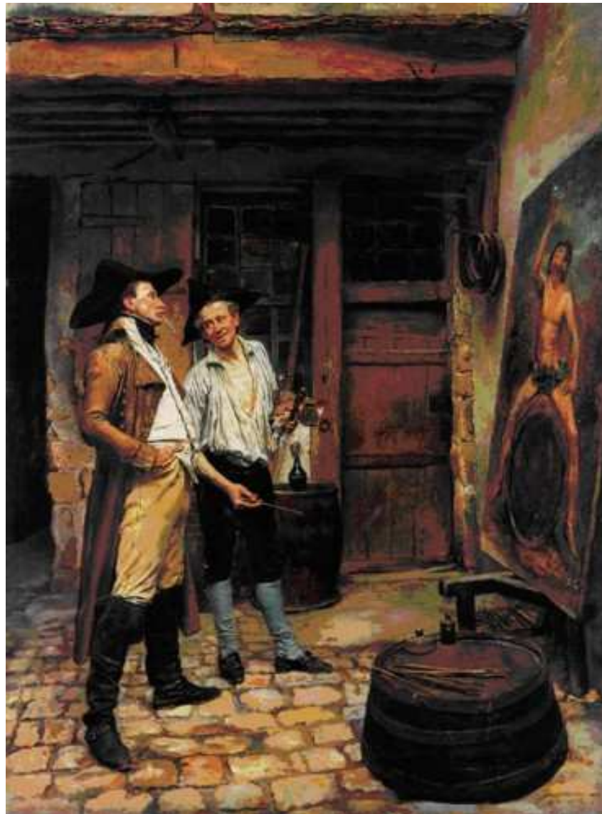
18 Ernest Meissonier: Der Schildermaler , 1872, Öl auf Leinwand, 59,5 x 44,8 cm, Hamburger Kunsthalle

Kehren wir zu Meissonier zurück. Wie ich bereits ausgeführt habe, scheinen viele seiner Sujets oft auf das kleine Format seiner Bilder abgestimmt. Sie zeigen Figuren, die ihre Aufmerksamkeit kleinen Dingen widmen. Diese Konzentration auf das miniaturhaft Kleine konnte jedoch auch ironisch gebrochen werden. Dies geschieht etwa in Meissoniers Gemälde Der Schildermaler (Abb. 18). Es zeigt einen Maler, der einem Offizier sein Werk vorführt – ein Wirtshausschild, das den Weingott Bacchus rittlings auf einem Fass zeigt.