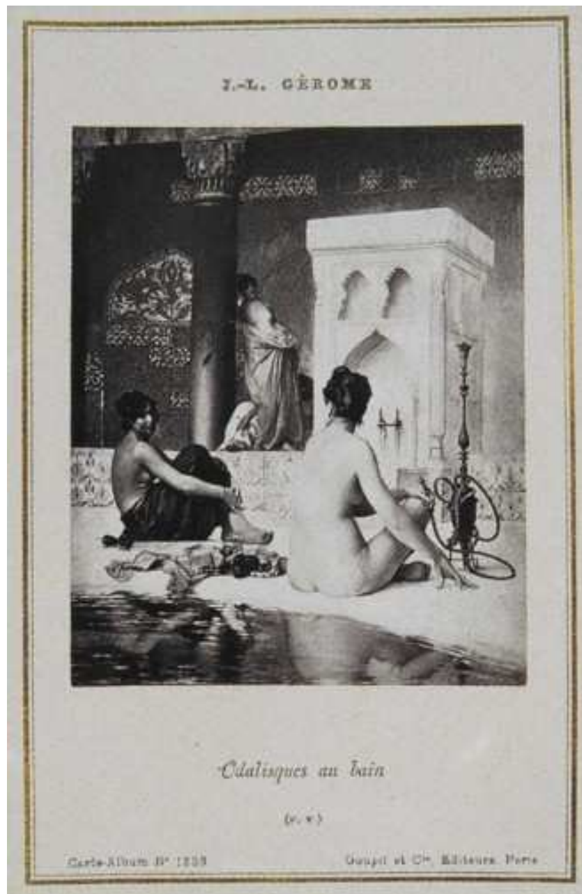
17 Léon Gérôme: Odaliskens im Bad , Fotografie von Goupil & Cie, »Carte album«, Nr. 944, 1981, 10,3 x 8,5 cm, Bordeaux, Musée Goupil

Gesteigert wurde dieser Peepshow-Effekt in der Edition seiner Werke in Visitenkartengröße durch den Kunsthandel Goupil. 37 Hier legitimierte bereits das Format von 10,6 x 9,1 cm einen Blick durch die Lupe, der sich moralisch sehr viel schwieriger rechtfertigen ließ (Abb. 17).