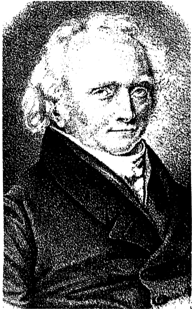
Für Christoph Wilhelm Hufeland (1762–1836) herrscht die Lebenskraft über den Körper.

Das Konzept von Gesundheit als richtige Proportion, Ebenmaß, richtige Stimmung, Einklang oder Schönheit basiert letztlich auf der Idee einer abgestuften Hierarchie der relevanten Teile.