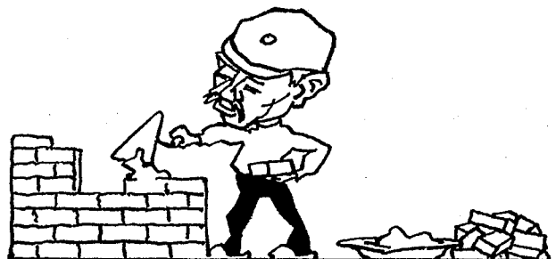
Den Aufbau, nicht die Lodderei, Das will die Deutsche Volkspartei.