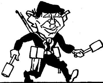
Wer für die Handgranaten ist, Bekenne sich als Kommunist.