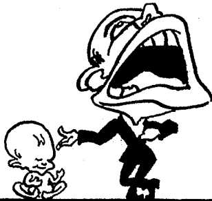
Mit großen Worten, kleinen Taten Betrügen euch die Demokraten.