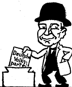
Und willst du's auch, greif' nicht daneben, Lass' dir den richt'gen Zettel geben. Dann kehrt auch Ordnung und Verstand Zurück ins deutsche Vaterland.