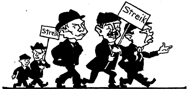
Für „Unabhängig“ stimmt der Mann, Der ohne Streik nicht leben kann.