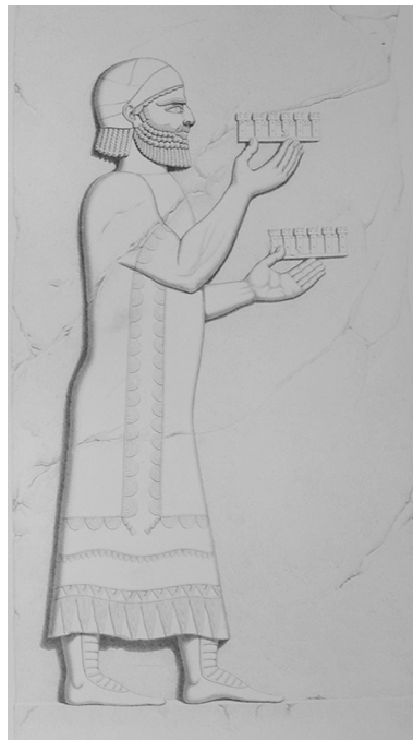
Abb. 2: „Stadtmodell“. Gabenbringer mit zwei „Stadtmodellen“ auf einem Orthostatenrelief aus dem Palast Sargons II. in Khorsabad.