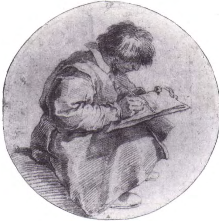
Abb. 39) Römisch, Sitzender Zeichner in langem Kittel , Rötél, 300 x 300 mm, Wien, Albertina um 1650 4