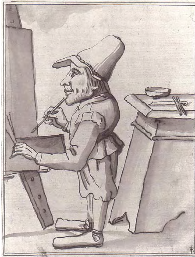
Abb. 41 Toskanisch (?), Karikatur eines Malers (um 1700 als „Gobbo dei Carracci“ identifiziert), lavierte Federzeichnung, 268 x 208 mm, New York, Robert Lehman Collection 6