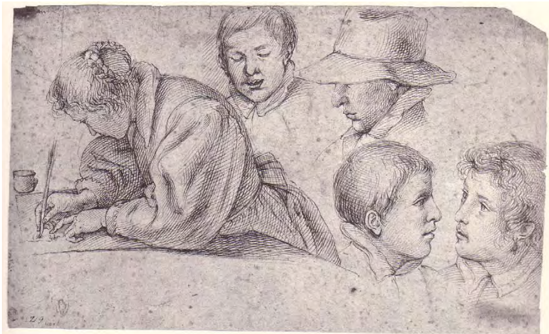
Abb. 38) Giovanni Battista Carracciolo, Zeichnendes Mädchen und vier Kopfstudien , Feder auf grauem Papier, 231 x 381 mm, Princeton, The Art Museum - Princeton University 3