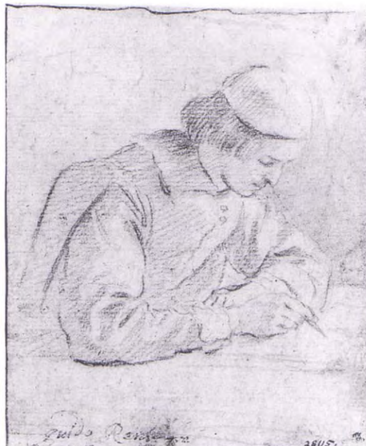
Abb. 42 Bolognesisch, Zeichner oder Schreiber , Rötél, 140 x 100 mm, Wien, Albertina 7