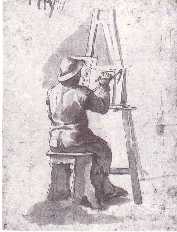
Abb. 37) Nachfolger des Annibale Carracci (?), Maler an der Staffelei sitzend , 242 x 184 mm, Chatsworth, Duke of Devonshire 2