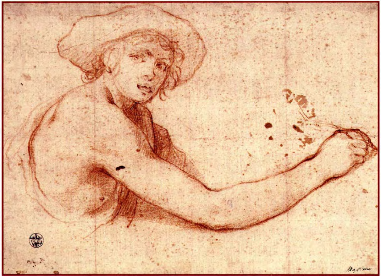
Abb. 43) Massimo Stanzione, Junger Zeichner , Rötzel, 197 x 267 mm, Berlin, Kupferstichkabinett 8