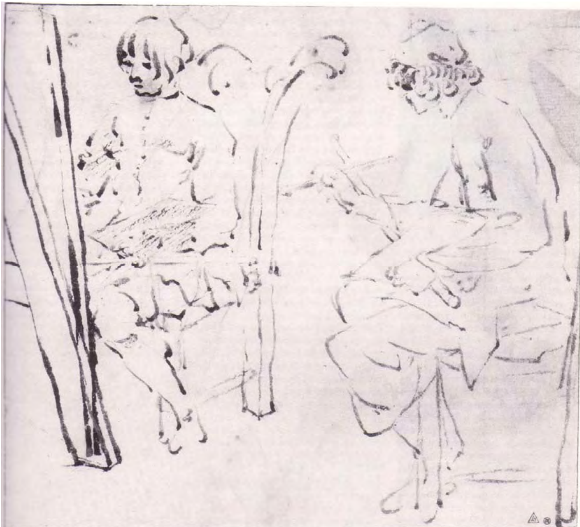
Abb. 36) Fabrizio Santafede, Zwei Maler bei der Arbeit , Pinsel in Braun und Rötel, 222 x 248 mm, Darmstadt, Hessisches Landesmuseum 1

Um der Frage nach „fact and fiction“ in der ‚Akademie‘ der Carracci näher zu kommen, wird eine möglichst umfassende Dokumentation von Zeichnungsblättern der Jahrzehnte um 1600 angestrebt, die Maler und Zeichner bei der Arbeit zeigen. Dabei ist der zeitliche Rahmen bewußt sehr weit gewählt, um auch nachverfolgen zu können, wie Zeichnungen früher vor allem aufgrund des dargestellten Sujets – vermeintlich ‚realistischen Momentaufnahmen‘ des künstlerischen Arbeitens und Werkstatt-Geschehens – in den Carracci-Umkreis gerückt wurden, nur um heute teils über einhundert Jahre später datiert werden. Die in diesem Nachtrag versammelten acht Zeichnungen ergänzen die Beispiele des Hauptteils.