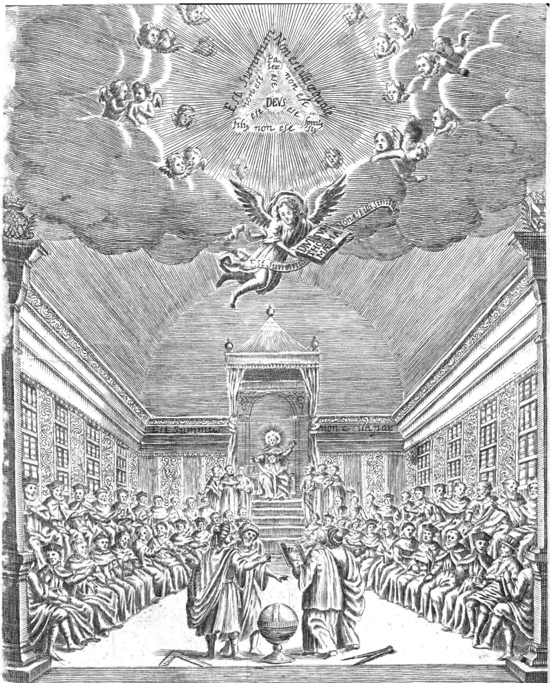
Ecce plus quam Salomon Hic ex Clement: VI. Papa Eleg: