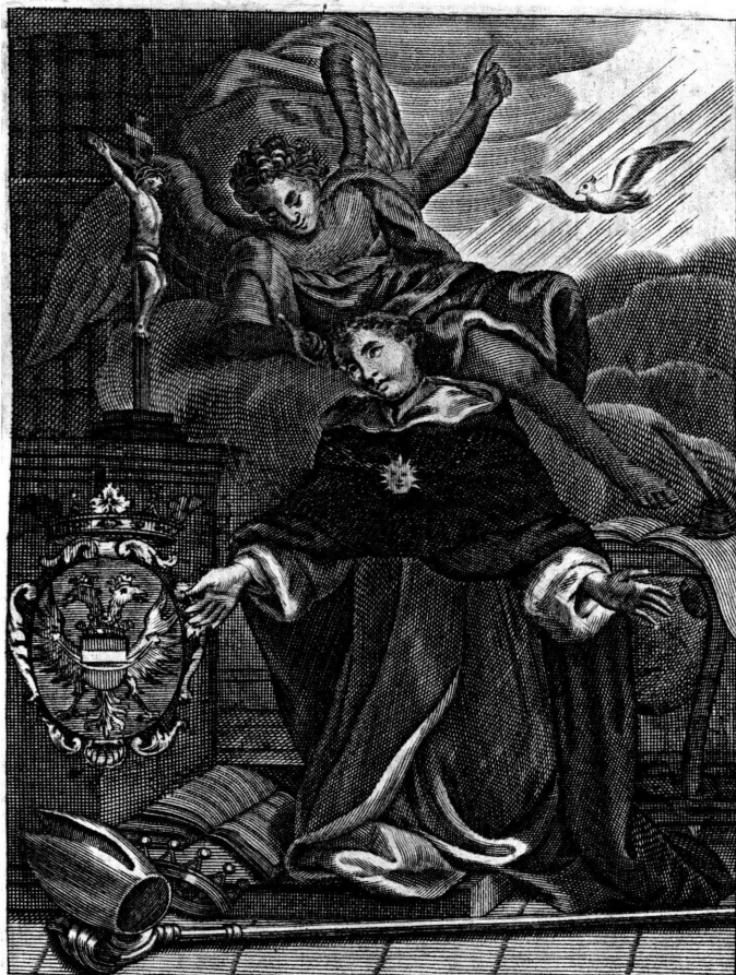
S. THOMAS Aquinas orn. Prædic. Vtg. Ecclesie Doctor.