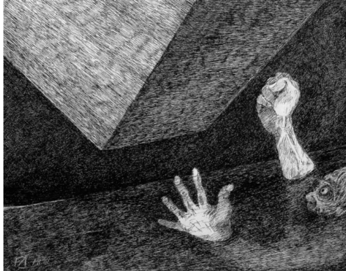
Friedrich Dürrenmatt, Apokalypse III, 1989, Feder, 36 x 50.

uns wegen seiner ungeheuerlichen Dynamik, die rein statisch wiedergegeben wird. Das Ende der Welt als Vergänglichkeit, die den Menschen erdrückt. Die Endlichkeit als die Grenze menschlicher Pläne? Das Bild regt zum Nachdenken an, beantwortet die gestellten Fragen allerdings nicht.