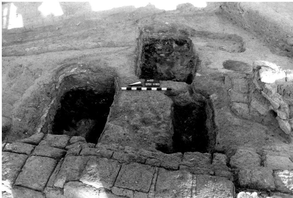
Abb. 10: Brandgrubengräber 03/03, 03/04 und 03/26