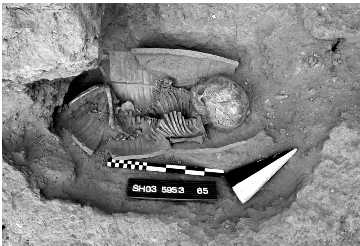
Abb. 3: Topfgrab 03/13 mit Körperbestattung