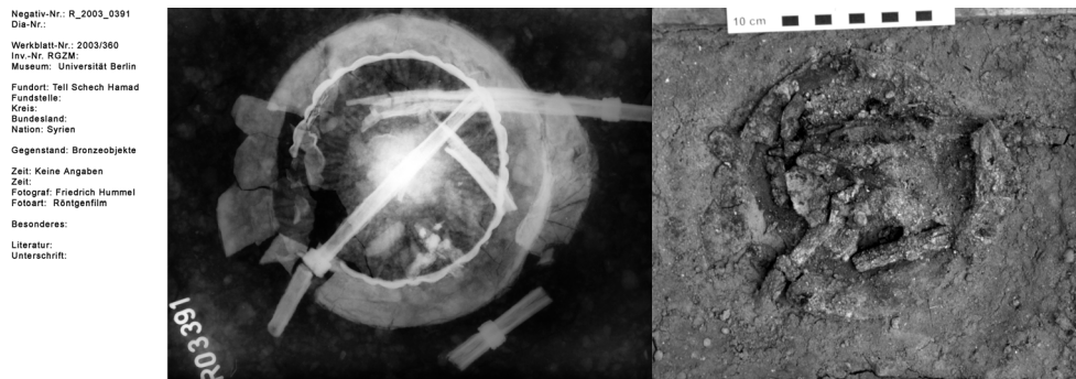
Abb. 11: Bronzeschale mit Trinkhalmen aus Grab 03/26: a) Röntgenaufnahme, b) Aufsicht der Blockbergung