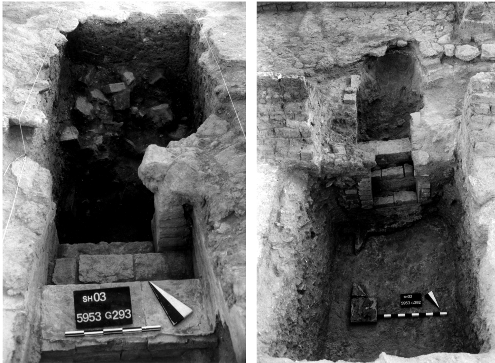
Abb. 1-2: Antik gestörte Gruft 03/28 aus gebrannten Ziegeln