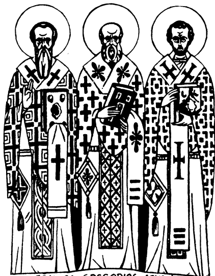
BASILIOS DER GROSSE GREGORIOS DER THEOLOGE JOHANNES CHRYSOSTOMOS