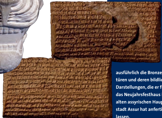
Abb. 6: Steinernes Löwenköpfchen (Ø ca. 10 cm), wahrscheinlich aus der assyrischen Hauptstadt Ninive, das einst als Knauf an einer Stuhllehne diente. Die Einlagen für Augen und Mähne fehlen, der Kopf trägt eine kurze Inschrift, die besagt, dass der König Sanherib (704–681 v. Chr.) das Objekt seinem Sohn Asarhaddon (680–696 v. Chr.) geschenkt hat (links).

Tontafel (8,5 x 5 cm) mit einer Inschrift des assyrischen Königs Sanherib aus der Stadt Ninive. Der König beschreibt