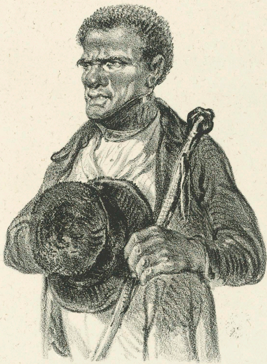
Ein Mann mit den besten Moralitäts-Zeugnissen versehen, wünscht eine seinen Fähigkeiten angemessene Anstellung, am liebsten bei einer Cassa .

Gez. u. lith. v. Lanzadotti, Wieden Wienstrasse N o 883 in Wien.