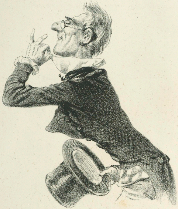
Ein Mann im besten Alter, von angenehmen Äußern, sucht sich eine Lebensgefährtin.