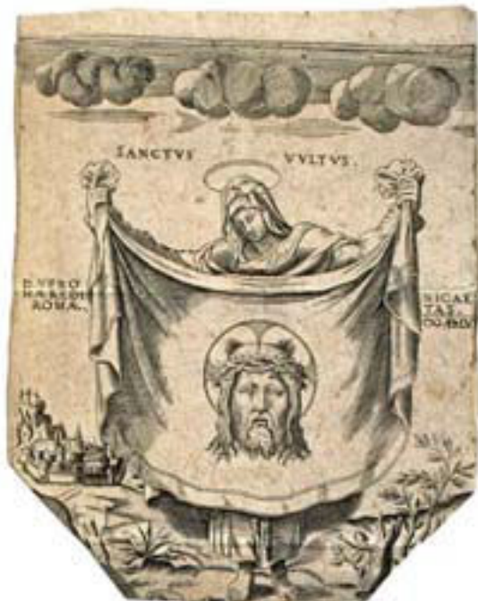
Figura 6 – Sanctus Vultus D. Veronicæ Hæreditas , incisione anonima, Roma 1556. Ivi.

È molto interessante notare il linguaggio che viene usato. Cosa significa la distinzione tra « images sumptas » e « copias », da un lato, e « figuras eiusdem vultus sanctus », dall'altro? Questa distinzione tra 'copie' e 'figure' della stessa immagine è forse introdotta per differenziare in qualche modo tra 'immagine sacra' (e sue copie o immagini da essa fedelmente desunte) e 'arte' che invece adatta, modifica e ricrea, in modo apparentemente innocuo?