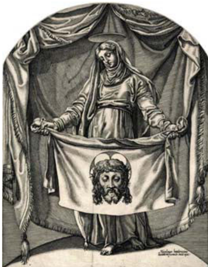
Figura 7 – Nicolas Beatrizet, da Muziano, Santa Veronica regge il Sudario [1557]. Londra, British Museum

Questo caso mostra insomma quanto discutibile fosse il limite tra cosa era considerato una copia fedele di un supposto originale (in questo caso reputato alla stregua di una reliquia) e cosa fosse invece considerato un prodotto artistico, anche se pur sempre devozionale, indipendente dall'immagine, o oggetto, propriamente 'sacri'. In questo caso, i motivi della contestazione dell'immagine non sono quindi di tipo, per così dire, teologico, e neanche di natura estetica. È il mero atto di riprodurre una 'reliquia' originale che è contestato. Tuttavia, i limiti di questa contestazione sono ambigui quanto le differenze tra una vera e propria 'immagine sacra' e una rappresentazione artistica o anche metapittorica del volto di Cristo (come è il caso della Santa Veronica che espone il velo con l'impressione del volto).