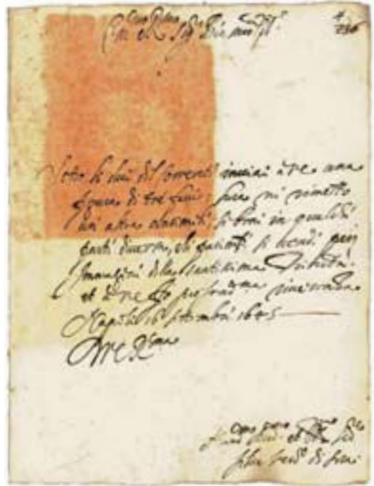
Figura 11 – Ibid. , c. 3r

per intendere il sentimento della S. Congregazione (del Sant'Uffizio)». Il vescovo di Sora scriveva che «si vende in questa città (Napoli) da pittori un quadro con tre faccie uniforme sotto pretesto che sia l'immagine della S.ma Trinità». Su foglio separato, il vescovo allegava un disegno a lapis a tutta pagina, tratto dal quadro (fig. 10). Il 13 settembre la Congregazione rispondeva al vescovo «ut nihil innovet circa picturas trium imaginum exprimentem S.mam Trinitatem» — questa risposta sembra di tipo interlocutorio: invita il vescovo a non agire. 32