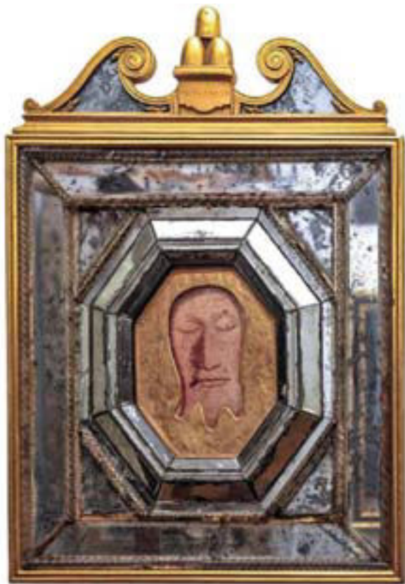
Figura 1 – Copia del Volto Santo, 1622. Roma, Chiesa del Gesù