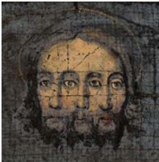
Figura 12 – «Aliam picturam rappresentantem SS. Trinitatem diversam ab alia transmissa, constat in una facia sola, quae tres facies unitas exprimet», pittura su tela, ACDF, S.O., Stanza Storica B 4 f, n. 5, c. 3bis