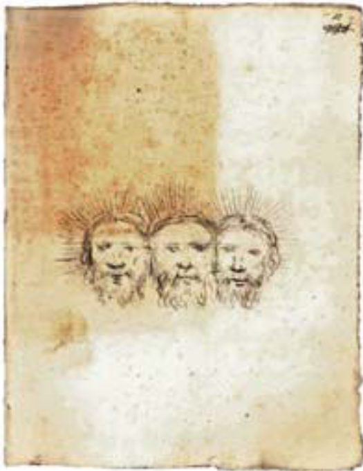
Figura 10 – «Exemplar imagini rappaesentantis tres facies separatas cum radiis, quas Neapolis venditur», disegno a lapis, ACDF, S.O., Stanza Storica B 4 f, n. 5, c. 2r