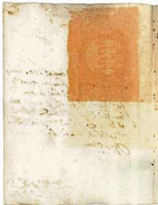
Figura 13 – Ibid. , c. 3v

Risulta evidente la differenza tra la prima e la seconda immagine della Trinità, differenza accentuata anche dal fatto che nel primo caso si tratta di un disegno abbastanza ben fatto del quadro in questione, mentre nel secondo caso sembra trattarsi dell'immagine originale: con le tre teste affiancate, la prima soluzione appare molto più armoniosa, mentre la soluzione dell'unica faccia con quattro occhi e tre nasi («picturam rappresentantem SS. Trinitatem [...] constat in una facia sola, quae tres facies unitas exprimet») rientra nella categoria del mostruoso, pur avendo anch'essa una lunga tradizione alle spalle. 34 Il riferimento è sempre alle tre entità, allo stesso tempo identiche e diverse, ma la soluzione visiva e la tecnica artistica dell'immagine portata all'attenzione degli inquisitori (della prima, non conosciamo come e quale fosse l'opera originale) sono diverse, con diversi effetti sull'osservatore (e, forse, sul censore, visto che al momento dell'invio della prima immagine non si prese alcuna decisione). È da escludere che il primo disegno fosse eseguito dallo stesso Tamburelli, ma bisogna invece immaginare che egli avesse chiesto a qualcuno di competente di riprodurre graficamente il primo dipinto.