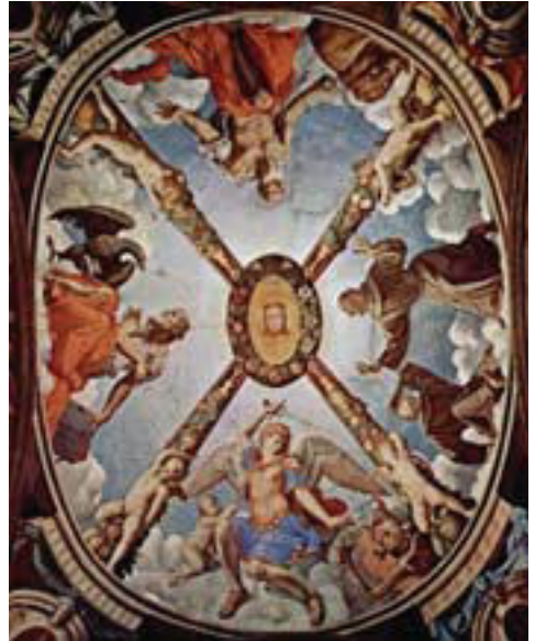
Figura 9 – Bronzino, Cappella di Eleonora de Toledo, Soffitto, 1540-1545. Firenze, Palazzo Vecchio

fede' ed essere 'un mostro' sono due cose completamente diverse. Il secondo giudizio è quello Jean Gerson relativo alle immagini della Trinità raffigurate all'interno delle cosiddette vierges ouvrantes : raffigurazioni da evitare in quanto, anche queste, incarnazioni mostruose sprovviste, non solo, di religione, ma anche di bellezza («nulla in eis est pulchritudo, nec devotio»). 29