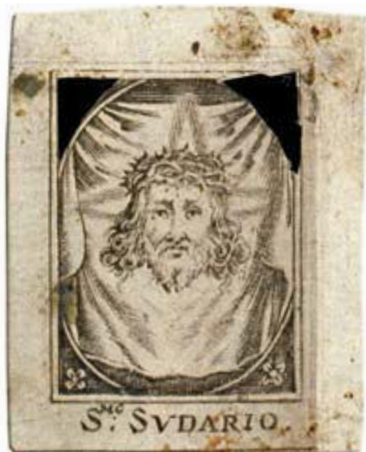
Figura 3 – Santissimo sudario , incisione anonima. Archivio Segreto Vaticano, Congregazione Vescovi e Regolari, Reg. Episcop. 74 (1628), 78v e ss.