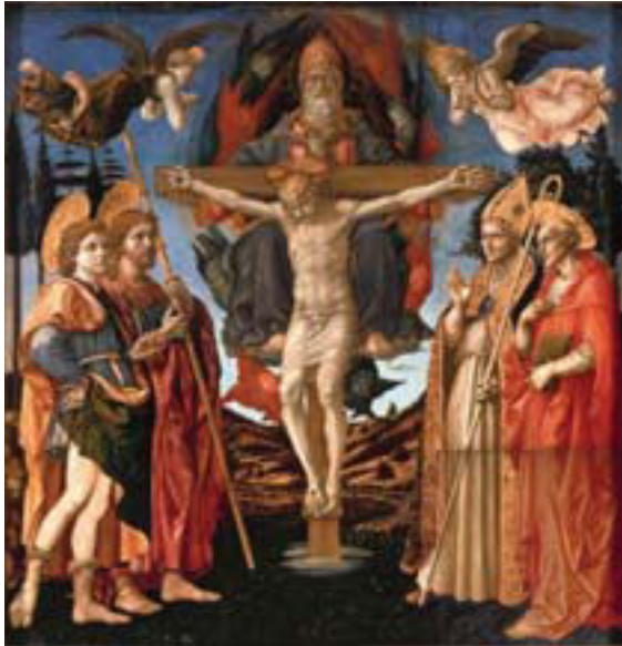
Figura 8 – Pesellino e fra' Filippo Lippi, Pala della Trinità, 1455-1460, dall'Oratorio della Compagnia della Santissima Trinità di Pistoia. London, National Gallery