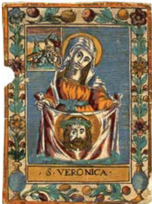
Figura 5 – Santa Veronica , xilografia colorata. Ivi.