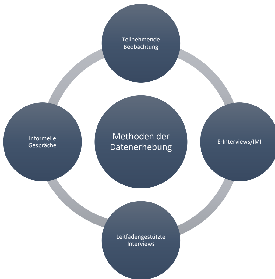
Abbildung 2 - Methoden der Datenerhebung

Der Forschungsprozess und die Datenerhebung sind auf einen Zeitraum von zwei Jahren des Förderzeitraumes ausgelegt gewesen; es existieren mehrere Phasen der Datenerhebung und der Datenauswertung die parallel zu Schreibphasen vorgenommen werden. Nachfolgend werden die Methoden der Datenerhebung dargestellt. Im Sinne der Triangulation werden verschiedene Methoden der Datenerhebung je nach Situation verwendet. Auch gibt es Methoden, die für eine bestimmte Phase in Frage kommen, beispielsweise das Instant Messaging Interview (IMI) zum Nachfragen von offenen Punkten oder anderen Details. Oder aber die Fokussierung auf