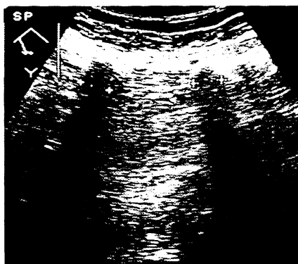
Abb. 4: Mittelbauchsonographie (3,5 MHz Konvexschallsonde): Darstellung von zwei sichelförmigen Reflexen im Dünndarm mit dorsaler Schallauslöschung. Die als Body-Packs interpretierten Reflexe waren nur aufgrund des lokalen Druckschmerzes differentialdiagnostisch von Luftsicheln abzugrenzen.

lagen im Magenantrum. Als sonographische Beurteilungskriterien zur sicheren Identifizierung der Päckchen im Magen dienten: