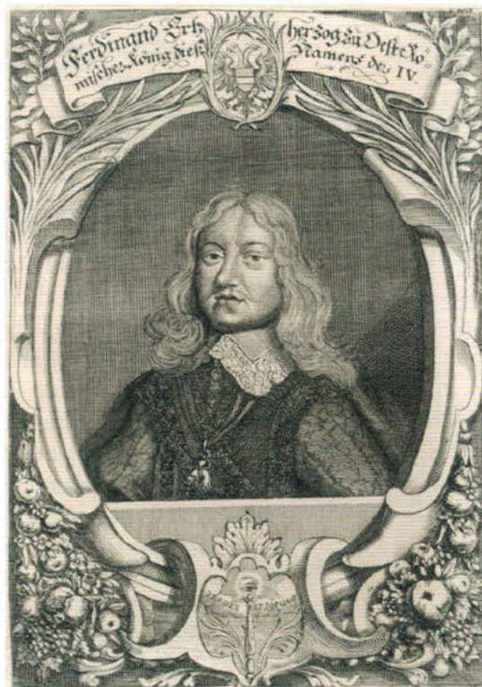
Ferdinand IV. byl prvorozeným synem Ferdinanda III. a od roku 1653 římským králem.

Na konci června 1654 onemocněl následník pravými neštovicemi. Protože dosud nikdo z jeho rodiny tuto nebezpečnou a silně nakažlivou nemoc nepřežil, musel císař se zbytkem rodiny uprchnout z Hofburgu. Po přechodném zotavení se 7. července objevily příznaky nemoci na jeho dýchacích cestách, „což mu postupně bralo dech a život“. Ferdinand IV. podlehl nemoci 9. července 1654. Jeho otec propadl těžké trudomyslnosti, na několik týdnů se stáhl do Kaiserebersdorfu a koncem července do karmelitánského kláštera. Smrt následníka trůnu dopadla na Habsburky velmi těžce. Dokonce se psalo a mluvilo o několika záležitostech, které této smutné události předcházely. Šlo nejen o zatmění slunce, ale také o malé zemětřesení a ulétnutí jednoho ze dvou orlů, kteří se chovali v Hofburgu. Orel byl erbovním zvířetem říše krále Ferdinanda IV. 515 Cestou z Augšpurku do Řezna navštívil Ferdinand IV. Altötting a spatřil tu urnu se srdcem Maxmiliána I. Bavorského. Své srdce dal pochovat v urně do loretánské kaple ve vídeňském augustiniánském kostele. Tím založil dlouhou habsburskou pohřební tradici. Nově zbudované castrum doloris ke smuteční slavnosti Ferdinanda IV. bylo korunováno fénixem podobajícím se orlu. Tvarem napodobovalo mohutný vítězný oblouk a ozdobeno bylo postavami uctívaných králů, kteří vypadali, jako by spali. 516